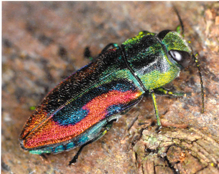
Der bunte Kirschprachtkäfer ( Anthaxia candens ) gehört zu den geschützten Tierarten der Schweiz. Der seltene Käfer ist nicht schädlich, denn die Larven ernähren sich einzig aus beschädigten oder absterbenden Pflanzanteilen.

bewirtschafteten Waldbeständen werden zehn Biotopbäume je Hektar angestrebt – Bäume also mit Höhlen, mit Konsolenpilzen oder mit freiliegendem Holzkörper. Künftig sollen im Betrieb Ebrach 150000 solcher Bäume stehen.