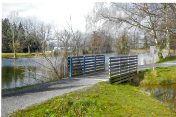
Am Anfang stand der Naturschutz, die Erholung kam später dazu.

spielsweise auf das Zürichseeufer, den Uetliberg oder die landschaftlich ansprechende Tössegg. Die Räume dazwischen bleiben hingegen mehrheitlich unbeachtet. Zudem birgt deren Lage in Landwirtschaftszonen oder in Naturschutzgebieten oft Potenzial für Nutzungskonflikte: Hier gilt Erholung eher als störend denn als bereichernd.