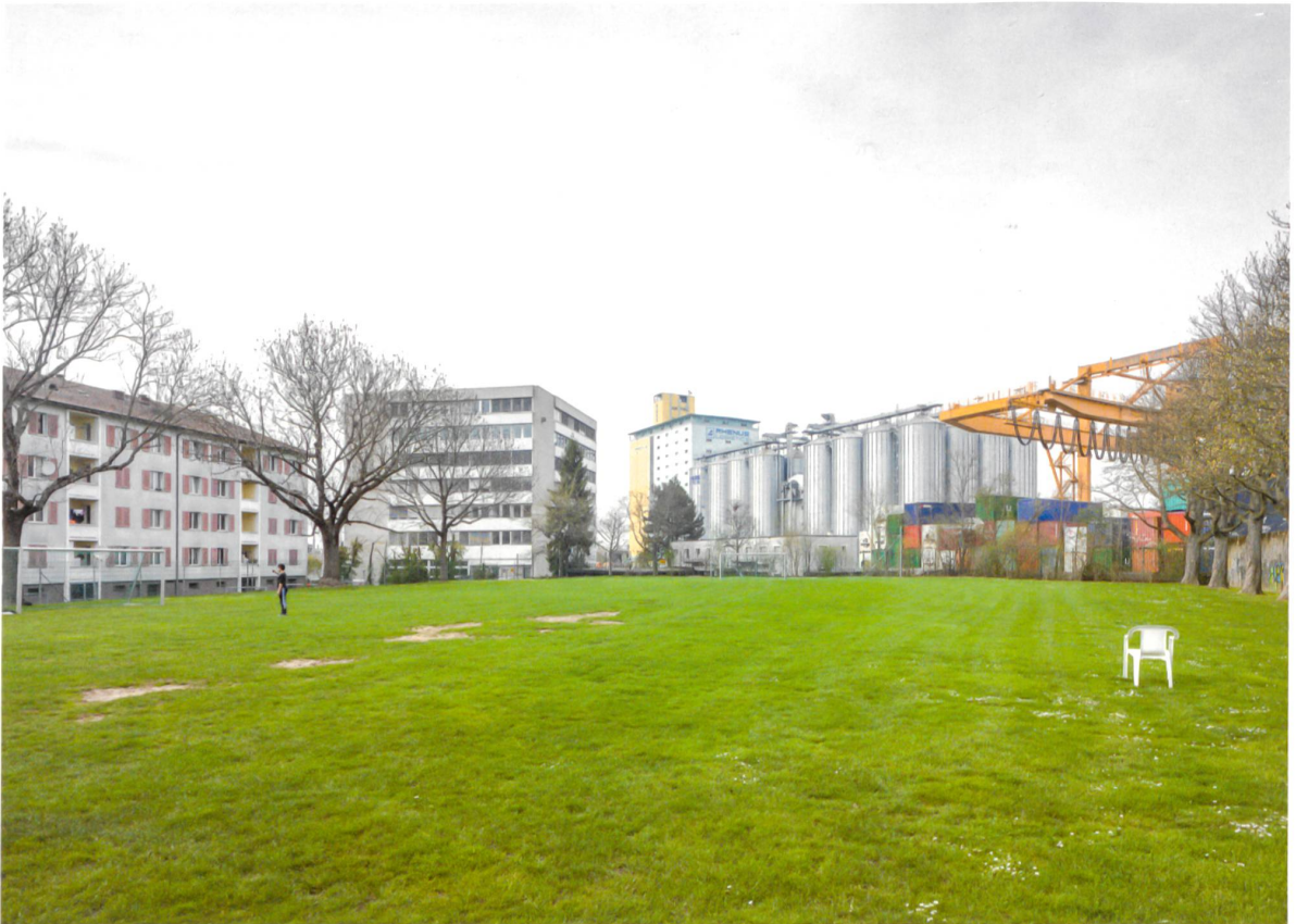
Weite trotz hoher Nutzungsdichte: Schiffe liegen im Hafenbecken II. Zwischen Containern, Industrie- und Verwaltungsbauten findet man einen Grünraum für die Bewohner des Quartiers.