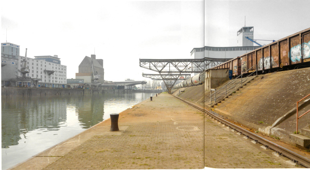
Blick von der Westquaiinsel über das Hafenbecken 1. Der zukünftige Stadtteil auf dieser Insel befindet sich unmittelbar neben einem funktionierenden Hafen. Hier wird es um ein Miteinander von Hafen und Stadt gehen.

Nur wenige Schritte trennen den historischen Kern des ehemaligen Fischerdorfs Kleinhüningen (vgl. «Ein Dorf wird Hafenstadt», S. 35) von den Hafen- und Industrieanlagen. In nur ein oder zwei Jahrzehnten wird die Stadt am Rhein hier ganz anders aussehen: Der geplante Ausbau der Hafeninfrastruktur führt dazu, dass sich die Gebiete in Hafennähe, auf der Westquaiinsel und entlang der Rheinufer markant verändern werden. Doch diese Entwicklung bleibt nicht auf die Quartiere Kleinhüningen und Klybeck begrenzt, vielmehr wird sich die Transformation dieses ca. 50 ha grossen Areals auf die gesamte Region im 3Land auswirken.