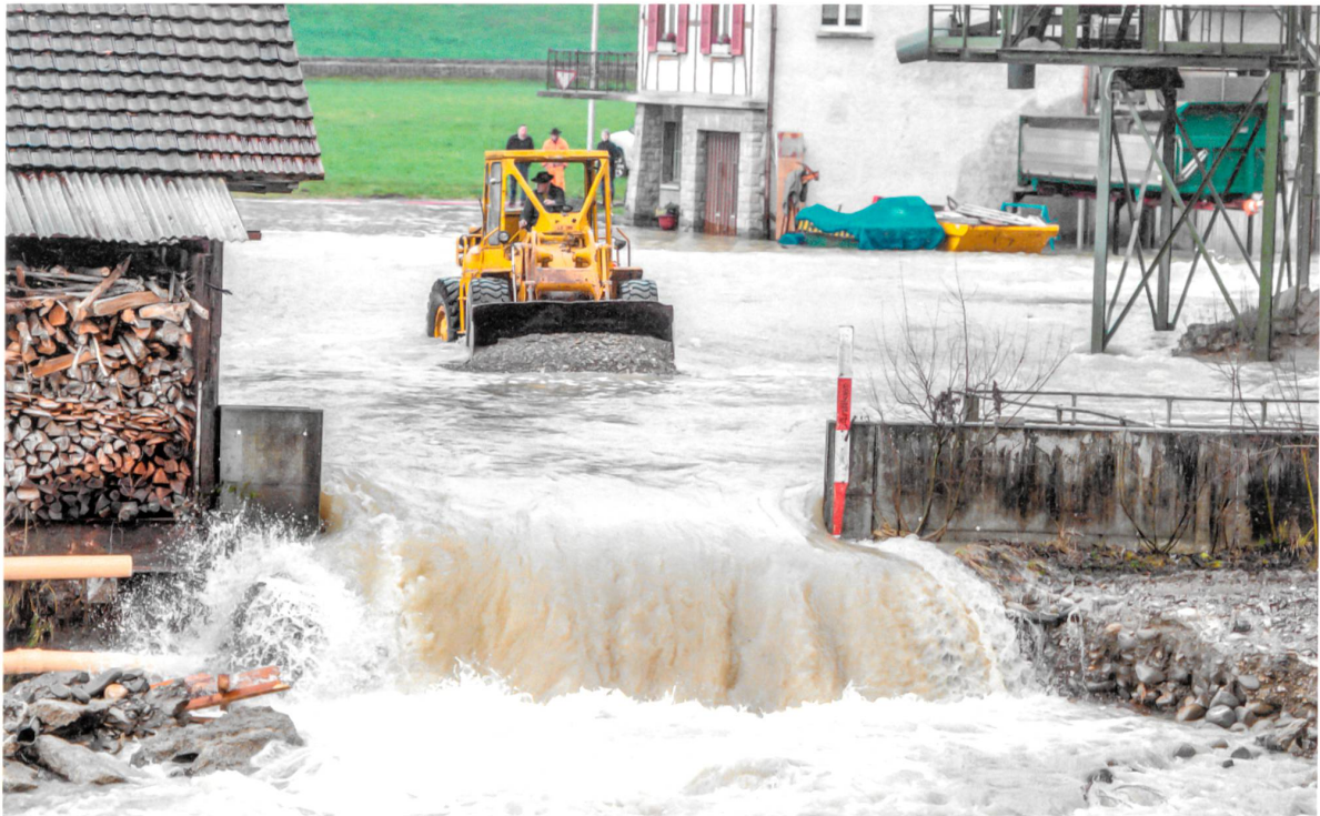
Am 11. Januar 2016 in Wolhusen LU : Nach einem Felssturz in die Kleine Emme folgten Überflutungen und Stromausfälle .

der TGV-Verbindung waren plötzlich viel mehr Passagiere diesem Risiko ausgesetzt. Um dieses wieder auf ein vertretbares Ausmass zu reduzieren, errichtete man für zwei Millionen Franken Steinschlagnetze. Dumm nur, dass der TGV heute nicht mehr durchs Val de Travers fährt. Ein anderes Beispiel: Die Bahnstrecke Zürich–Bern verläuft kurz nach Olten am Fuss des Born, eines Jura-Ausläufers. Durch die Frequenzsteigerung im Rahmen von Bahn 2000 wurde dieser Abschnitt zu einem Hotspot des SBB-Netzes bezüglich Naturgefahren. Der Zugverkehr war plötzlich so dicht, dass sich umgerechnet ständig 200 Personen im gefährdeten Gebiet aufhielten. Aus diesem Grund bauten die SBB Steinschlagschutzwände. Auf der Gotthard-Bergstrecke hingegen wird nach der Inbetriebnahme des Gotthard-Basistunnels infolge der geringeren Passagierfrequenzen das Risiko abnehmen.