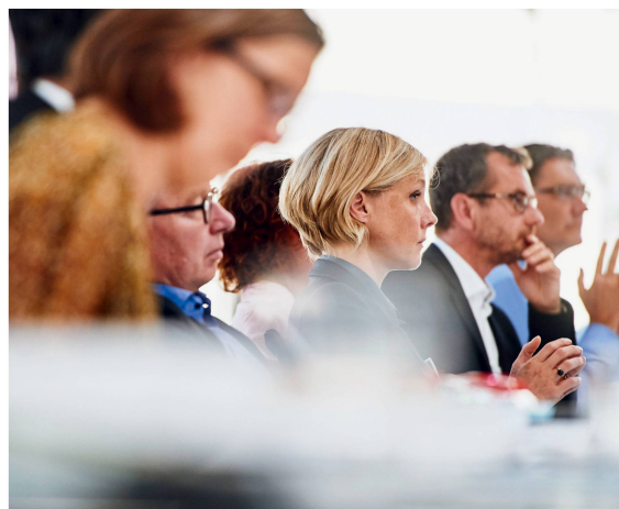
Konzentriertes Lesen und Zuhören an der SIA-Delegiertenversammlung 2015.

Z ur Delegiertenversammlung nach Genf? Bis nach Genf? Nicht alle Delegierten des SIA mochte die Wahl des Tagungsorts auf Anhieb begeistern, nachdem feststand, dass es in diesem Jahr in den westlichsten Zipfel der Schweiz gehen sollte. Als aber der Tag gekommen war, waren auch beim letzten Skeptiker die Zweifel verflogen. Über Genf, weltläufige Metropole mit kaum 200000 Einwohnern, aber 170 Nationalitäten, spannte sich ein strahlend blauer Frühlingshimmel, und das Restaurant im achten Stock der «Fédération des Entreprises Romandes Genève», wo man sich vor der Versammlung zum Apéro traf, bietet einen stupenden Blick über die Stadt, den See und die Berge, die teilweise schon zu Frankreich gehören. Später wurden die Delegierten zudem mit einem spannenden Vortrag von Isabel Girault belohnt: Die Direktorin des kantonalen Raumplanungsamts erläuterte die raumplanerischen Herausforderungen und Projekte in der Agglomeration.