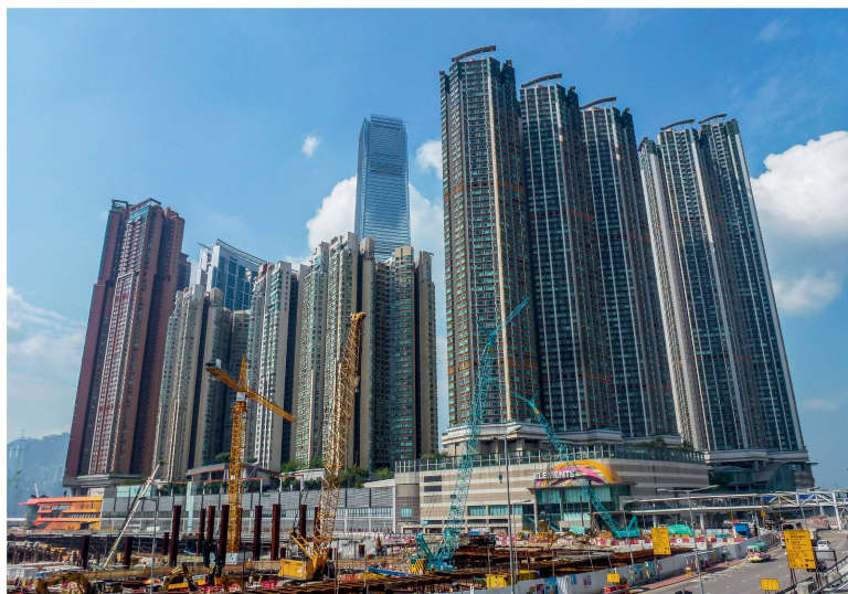
Himmelstrebendes Hongkong: Hochhaustürme brauchen viel Betriebsenergie.

M it zwei Energieexperten war die Schweiz zu Gast am Annual Forum des Hong Kong Institute of Engineers, das am 17. April 2015 im Hong Kong Convention Centre stattfand. Der Marktplatz Hongkong gilt als einer der liberalsten, sichersten und finanziell attraktivsten weltweit.