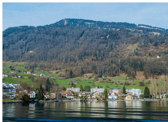
Der Chilenwald schützt Weggis.

Die Struktur der Schutzwälder der Luzerner Rigigemeinden ist dank der langjährigen Schutzwaldpflege gut. Mit gezielten Verjüngungsschlägen wird sie weiter verbessert. Die Bewirtschaftung der Wälder an