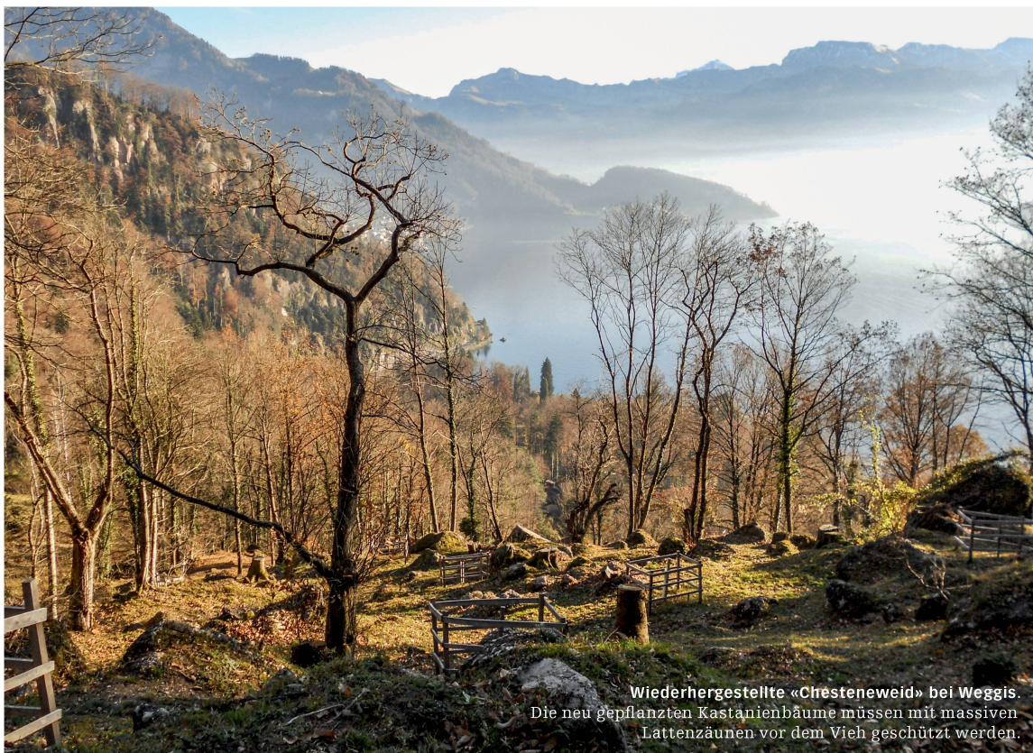
Wiederhergestellte «Chesteneweid» bei Weggis. Die neu gepflanzten Kastanienbäume müssen mit massiven Lattenzäunen vor dem Vieh geschützt werden.