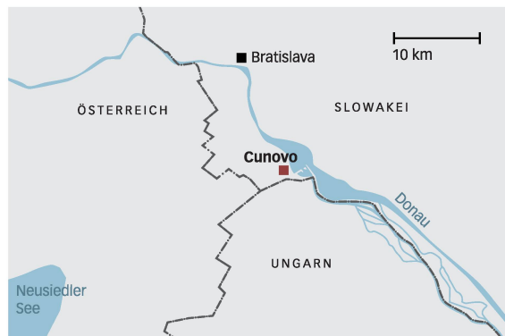
Cunovo liegt im Dreiländereck Österreich–Ungarn–Slowakei.

In Cunovo war es erforderlich, die am Kanalende – der bevorzugten Lage – fehlende Fallhöhe durch ein Wehr zurückzugewinnen. Der Wehrrücken dient der Umwandlung von potenzieller in kinetische Energie und ist ein Kompromiss aus wirtschaftlicher Bauweise (Trä-