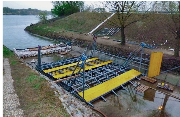
Schema der Anlage in Cunovo (oben) und Foto der beplankten Stahlkonstruktion (darunter). Künftig soll die Anlage auf Knopfdruck aktivierbar sein. Die Planung läuft gerade.

Berücksichtigung der hydraulischen Randbedingungen und der Lebensdauer berechnen – oder anders herum, eine wirtschaftliche Investitionssumme unter gewählten Randbedingungen festlegen. Betrachtet man die Welle in Cunovo mit ihrer Jahresleistung von 170 MWh bei einer reinvestitionsfreien Laufzeit von geschätzten zehn Jahren, kann man unter Ansatz eines fiktiven Energiepreises (z.B. 0.05 €/kWh) eine wirtschaftliche Erstinvestitionssumme errechnen. Zugegebenermassen ist dieser Ansatz vereinfacht und berücksichtigt keine Umwegerentabilitäten oder Risiken. Er soll aber veranschaulichen, dass wirtschaftlich vertretbare Investitionen bei Wellenanlagen je nach Jahresleistung in einer Grössenordnung von 100000 bis 200000 Euro liegen und nicht beim Zehnfachen davon. Vergessen werden darf auch nicht, dass hohe Investitionskosten in der Regel mit hohen Rückbaukosten verbunden sind, die den Errichtungskosten zugeschlagen werden müssen. Ziel der AWM ist es, finanzierbare Wellenbauwerke auch in kleineren Kommunen möglich zu machen. Dies kann nur gelingen, wenn der negative Einfluss auf die Umwelt und die Kosten in vertretbarem Rahmen bleiben. •