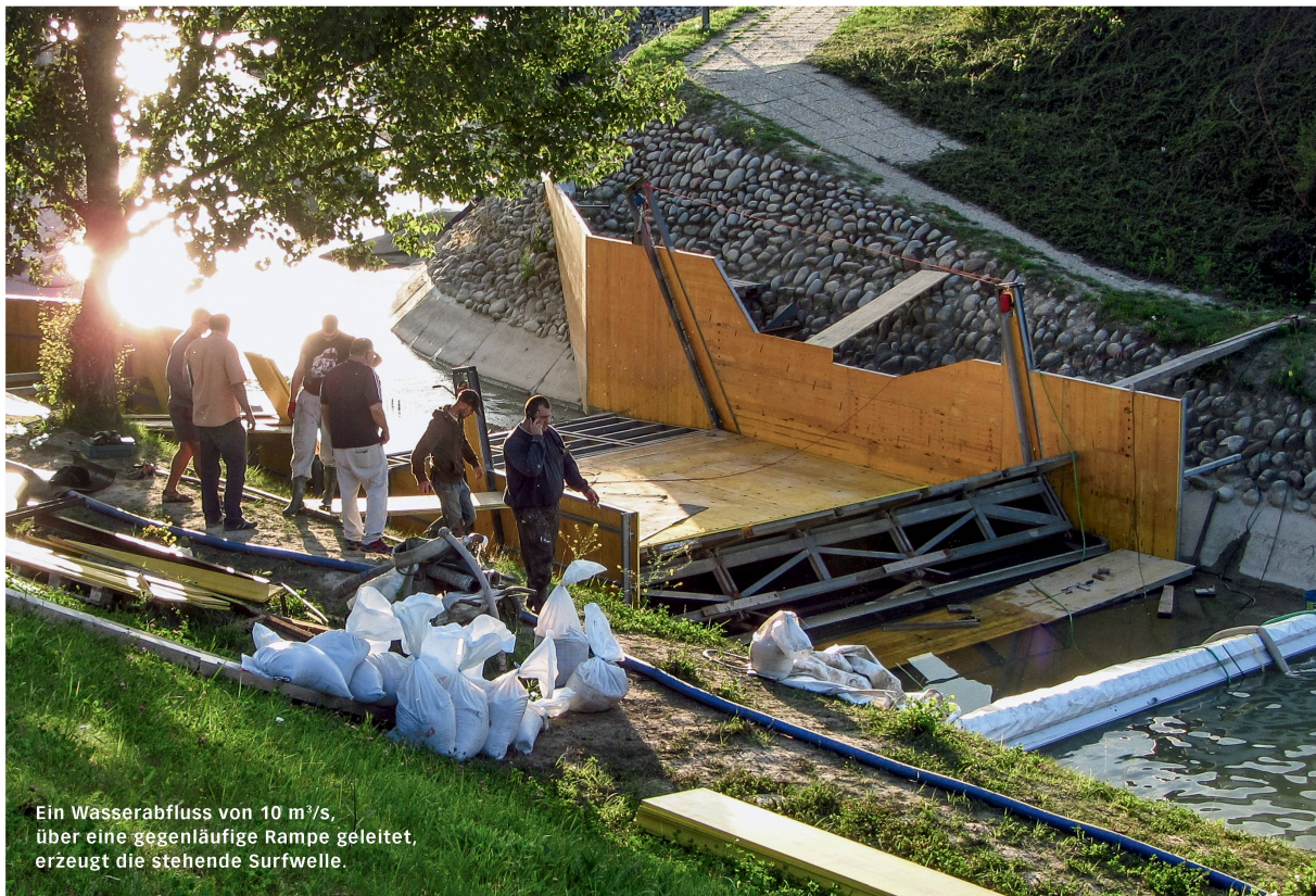
Ein Wasserabfluss von 10 m 3 /s, über eine gegenläufige Rampe geleitet, erzeugt die stehende Surfzelle.

Wellenreiten auf Flüssen hat in den vergangenen Jahren einen rasanten Aufschwung erlebt. An schönen Tagen wird es bereits eng auf den konstant laufenden und gut erreichbaren Wellen in Mitteleuropa. Völerorts gründen sich Welleninitiativen, um den Bau von Flusswellen voranzutreiben (vgl. Kasten «Schweizer Wellenprojekte», S. 28). Erfolgreiche Beispiele sind bisher allerdings Mangelware. In Österreich scheiterten mehrere Projekte – eine Katastrophe für den Sport, da die Entscheidungsträger zunehmend die technische Machbarkeit anzweifeln und sich die Finger nicht verbrennen wollen. Die Fehler wären aber mit fachmännischer Planung und