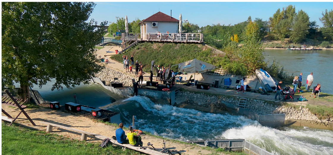
Derzeit kostet die Benutzung der Anlage in Cunovo acht Euro pro Tag. Die Sportler surfen auf einer 7.5 m breiten Welle. Die Wasserfilmdicke beträgt 40 bis 45 cm. Die Schwächen von Anlagen mit relativ niedrigem spezifischem Abfluss können ein erhöhtes Verletzungsrisiko und abgebrochene Finnen sein.

gerlänge) und hydraulischen Anforderungen (Neigung des Geschwindigkeitsvektors). Am Fusspunkt strömen die Wassermassen über eine veränderliche Länge horizontal, um anschliessend durch ein Rampenbauwerk wieder hangaufwärts gerichtet zu werden (vgl. Schema S. 36). Es kommt zu einer Rückumwandlung von kinetischer in potenzielle Energie und Druckhöhe (Wassertiefe) bei gleichzeitiger Reduktion der Fließgeschwindigkeit. Der Satz von Bernoulli liefert dafür die theoretischen Grundlagen. Das Rampenbauwerk gibt die Strömungsrichtung vor, bestimmt die Form der Welle und entkoppelt sie weitgehend vom Unterwasser. Mit zunehmender Höhe des Unterwassers wird die Welle bis hin zu einer kritischen Höhe positiv beeinflusst (steilere Welle), darüber hinaus ist der Einfluss aufgrund der Potenzialreduktion negativ und führt bei weiterem Anstieg zum Zusammenfallen der Welle. Während der Oberwasserspiegel der Welle von der Stellung des Wehrs abhängt, wird die Höhe des Unterwassers von einem ungarischen Kraftwerksbetreiber bestimmt (Ober- und Unterwasser ist entkoppelt).