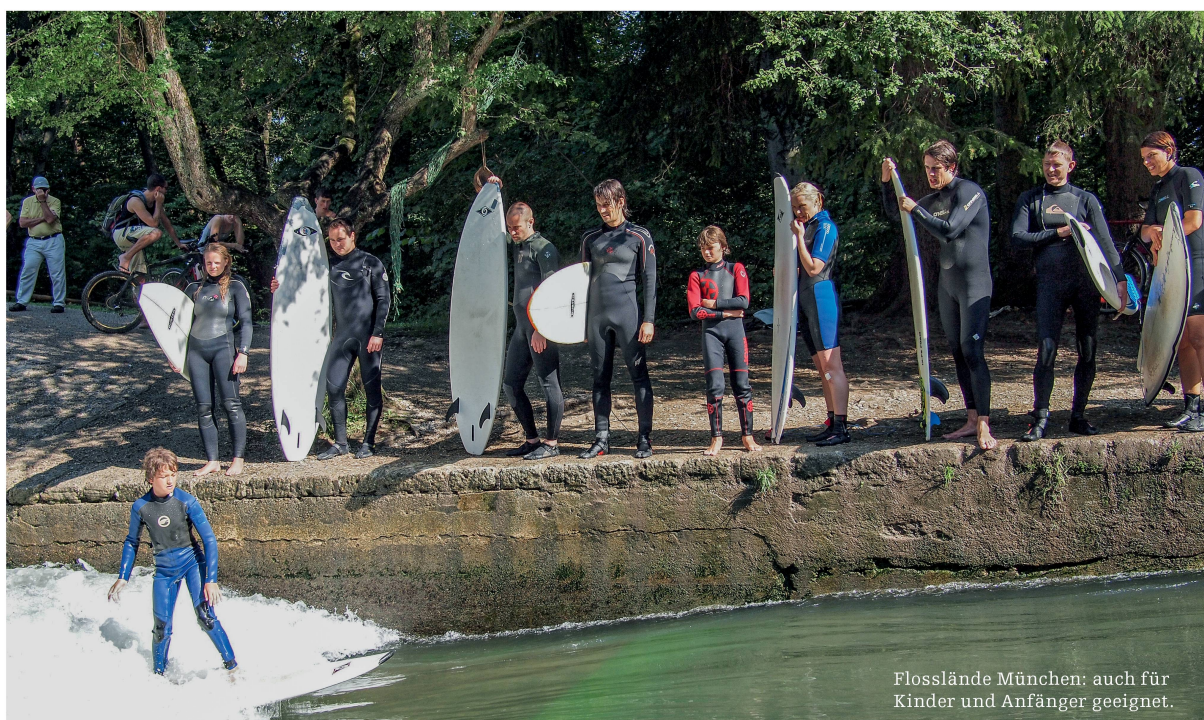
Flosslande München: auch für Kinder und Anfänger geeignet.