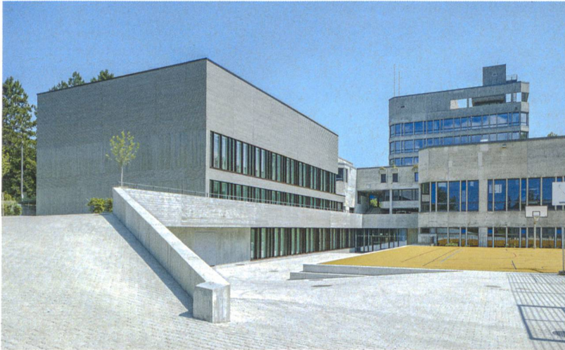
War 2014 zu besichtigen: die von Sabarchitekten aus Basel geplante Doppelturnhalle des Gymnasiums Liestal BL.

vom privaten Wohnhaus über Schulhäuser, Sporthallen, Verwaltungs- und Kulturbauten hin zu grossen Infrastrukturbauwerken.