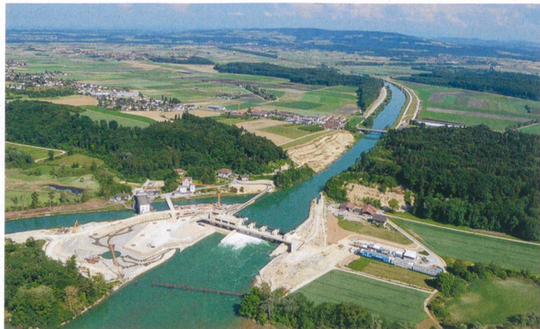
Mündung der Aare in den Bielersee, im Vordergrund das neue Kraftwerk, dahinter der Hagneckkeinschnitt mit dem abgetragenen Fels (links oben).