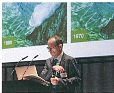
Lino Guzzella sprach über den hohen Rang energetischer Forschung an der ETH Zürich – und verschwundene Gletscher.

«Das ist alles gut und recht, aber führt der «Clean Power Plan» auch tatsächlich zum gewünschten Ziel?», entgegnete Bundesrätin Doris Leuthard in ihrer nachfolgenden Rede. Bei einer CO 2 -Reduktion von 17% sei noch viel Luft nach oben. Als politisches Signal der Vereinigten Staaten sei der Plan sicher hilfreich, auch mit Blick auf die bevorstehende Klimakonferenz in Paris. Jedoch seien die USA nach wie vor der mit Abstand grösste CO 2 -Emittent – nicht nur absolut, sondern auch pro Kopf der Bevölkerung. Doris Leuthard liess keinen Zweifel an der Dringlichkeit der zu bewältigenden Aufgaben: «Wir müssen uns darüber