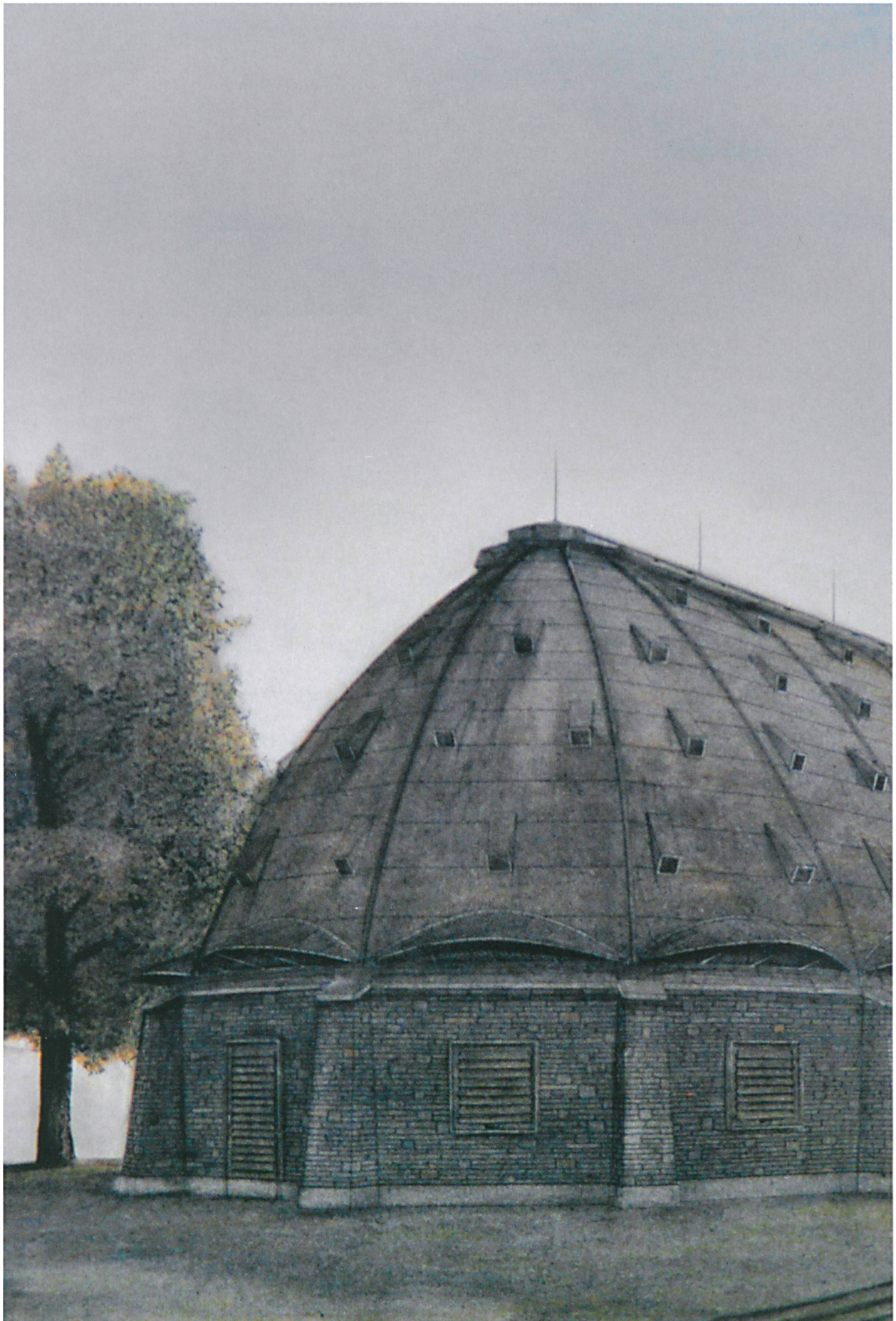
Diplom Sommersemester 1987; Ausflugsrestaurant Monte Generoso, Student: Quintus Miller.