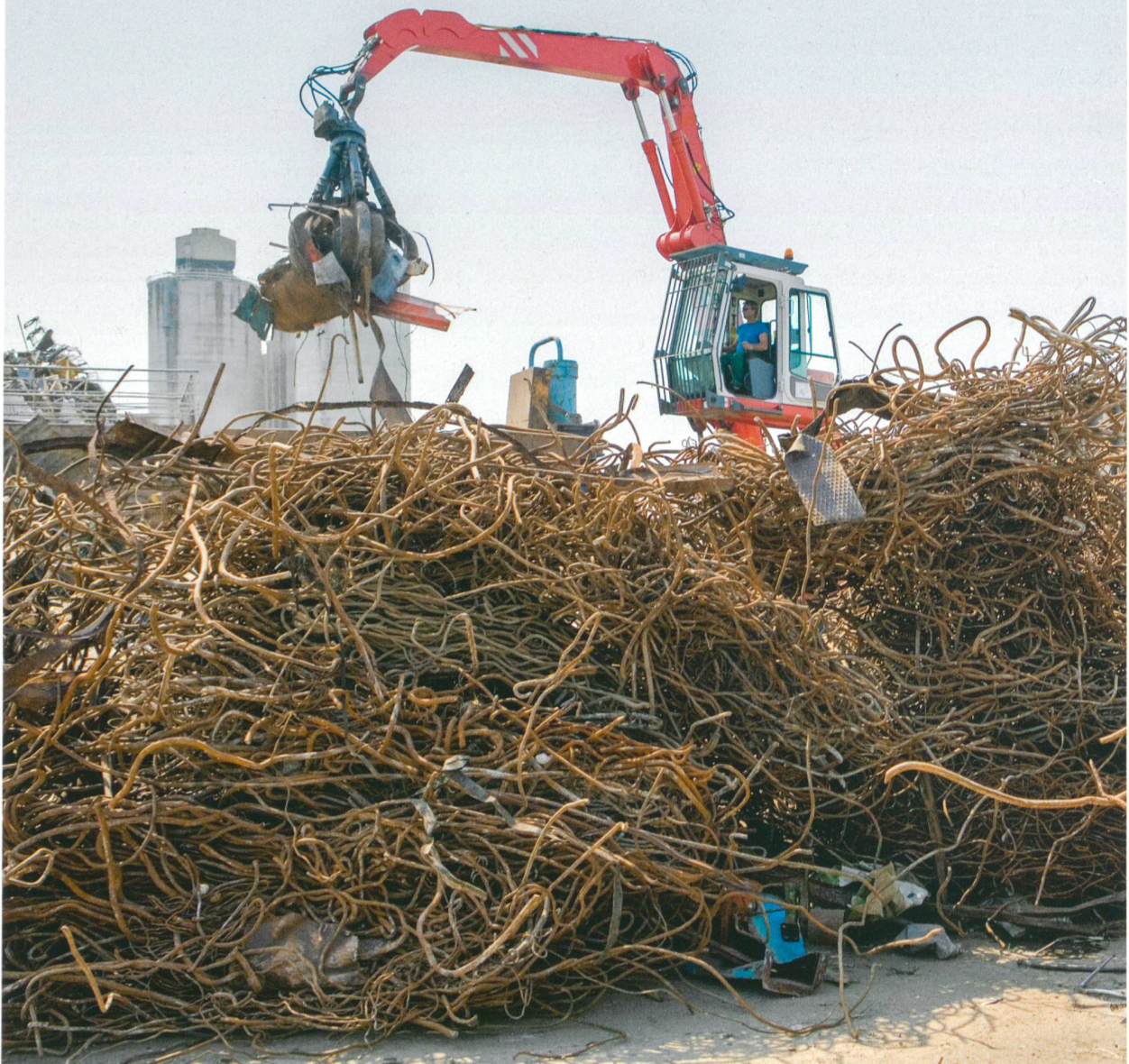
Armierungsstahl aus dem Gebäudeabbruch: vom selektiven Rückbau zum weiterverwertbaren Sekundärrohstoff.