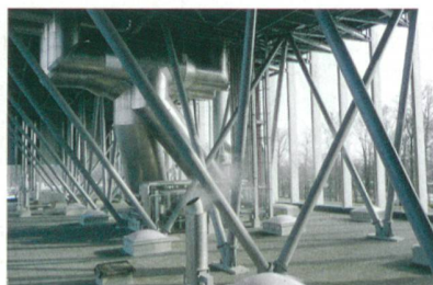
Sieger der Kategorie «Energie»: Energiezentrale Forsthaus in Bern.