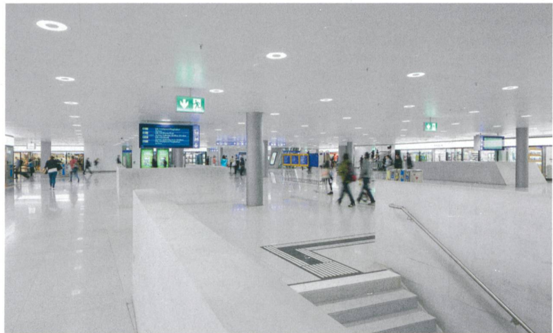
Gesamtsieger und Sieger Grund- und Infrastruktur: Durchmesserlinie Zürich (2001–2015). Die grössten Teile sind unsichtbar, doch dieses Bauwerk wird tagtäglich von Tausenden von Menschen benutzt oder betreten und hat eine wesentliche Auswirkung auf grosse Teile des schweizerischen Eisenbahnverkehrs. Ingenieure: IG ZALO, Basler & Hofmann / Pöyry Schweiz.

In der Kategorie «Hochbau» lagen die Nominierungen dank ihrer Qualität, ihrer Innovation und ihren sehr unterschiedlichen Richtungen so nah beieinander, dass für die endgültige Wahl zwei Durchgänge nötig waren. In der Kategorie «Industrie» hingegen wurde leider nur