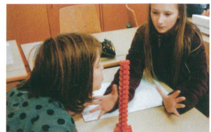
Sieger der Kategorie «Schulen»: Vermittlungsprojekt KIDSinfo.