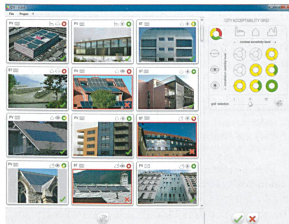
LESO-QSV Grid: Rechts oben ist die Matrix aus Sichtbarkeit der Anlage und Sensibilität der Bauzone. Die Mindestanforderung für die drei Teile des Doughnut-Diagramms (System-Geometrie, -Material und -Details) ist je nach Kontext höher (rot < gelb < grün). Links ist zu sehen, wie verschiedene Gebäude nach diesem System beurteilt wurden.

Die Methode LESO-QSV wurde als Tool für Behörden, Bauherren und Architekten entwickelt, damit sie das dreistufige Programm leicht anwenden können. QSV-Acceptability hilft Gemeinden, Anforderungen in einem soziopolitischen Kontext zu definieren und folglich zu bewerten. QSV-Grid visualisiert die Auswirkungen unterschiedlicher Entscheide auf das Siedlungsumfeld. Und mit QSV-Crossmapping schliesslich kann für eine proaktive Solarplanung die architektonische Sensibilität von Siedlungsflächen kartiert und mit digitalen Sonneneinstrahlungskarten abgeglichen werden.