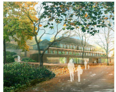
03 Blick von Südwest