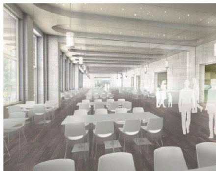
04 Speisesaal und Freeflow-Zone im EG