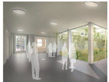
05 Eventbereich um den Orchideengarten im OG

Dämmung aus Recyclingglas. ISOVER – gelebte Ökologie.