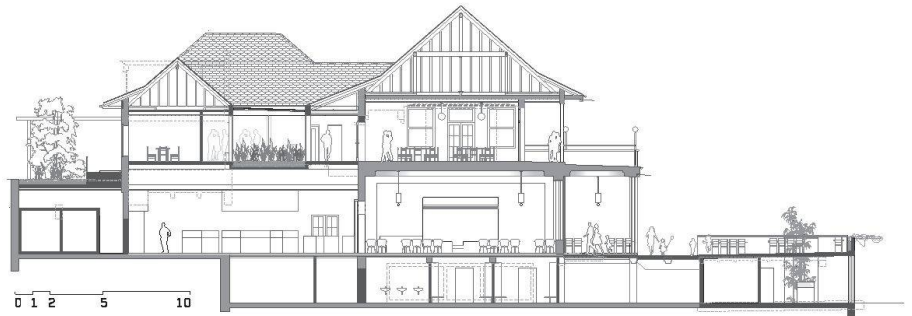
01 Flubacher-Nyfeler+Partner: Querschnitt (Pläne + Visualisierungen: Projektverfasser)

Einstimmig empfahl die Jury das Projekt von Flubacher-Nyfeler+Partner Architekten zur Ausführung. Als einziger Beitrag hat es die Typologie des Bestands beibehalten. Die Eingriffe in die Struktur sind vor allem innenräumlich. Die beiden Seitenflügel des vorderen, zur Terrasse ausgerichteten Saals bleiben erhalten und werden in den offenen Restaurantbereich integriert. Auch die Treppe wird nur durch einen grösseren Umraum und durch einen grösseren Lift ergänzt. Im Obergeschoss werden die bestehenden Höfe zugunsten eines zentralen Lichthofes aufgelöst. Der Gang um einen «Orchideengarten» klärt die derzeitige unattraktive Eingangssituation zur Strasse und