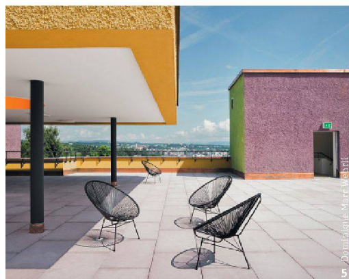
5 Do Paloniés - Marwé - 1711

DM: Se sono diventato presidente di sezione è merito del sistema proprio della Società; in altre parole si tratta di una carica per la quale non ci si può né candidare né fare avanti. Si viene interpellati. Così è successo anche a me: nel 2005 mi è stato chiesto se avevo interesse a diventare membro del comitato della sezione. Poi un bel giorno, l'allora presidente mi disse che da lì a un anno si sarebbe ritirato e che voleva propormi come suo successore. Naturalmente ne rimasi assai lusingato. Provengo da una famiglia di architetti, anche mio padre era architetto, ma essendo italiano non aveva mai potuto affiliarsi alla SIA. Fin da piccolo quindi ho sempre considerato un grande onore il fatto di poter essere membro SIA. Certo, rivestire la mansione di presidente di sezione prende del tempo; dedico circa un giorno alla settimana a questa carica, ma lo faccio con gioia.