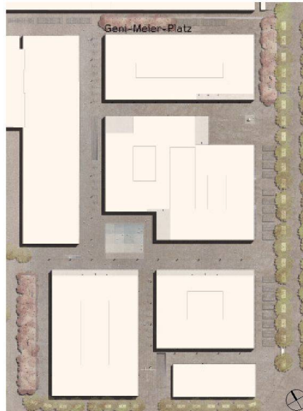
01–04 Zur Weiterbearbeitung «dr Eskimo» (Andreas Geser Landschaftsarchitekten): 1. Etappe (links) mit Resten des Zauns um das Zeughausareal und zentral gelegener Brachfläche (Zeughausgarten). Zustand nach der 2. Etappe (rechts) (Visualisierungen + Pläne: Projektverfasser)

Andreas Geser Landschaftsarchitekten aus Zürich gewinnen den Projektwettbewerb für die Aussenraumgestaltung des künftigen Verwaltungszentrums am Guisanplatz in Bern.