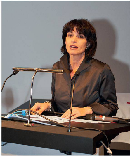
01 Bundesrätin Doris Leuthard