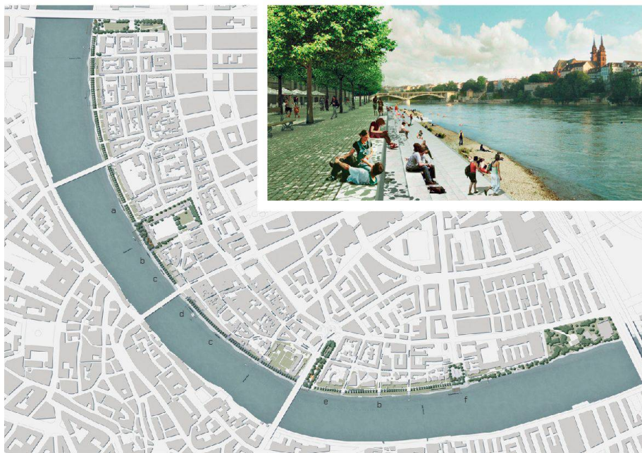
01 «rhein schauen»: zwischen Dreirosen- und Schwarzwaldbrücke – bewachsene Böschung (a), Flachufer (b), Sitztreppe (c), Kulturfluss (d), Pontonierstrecke (e), Schwimmanlage (f) (Bild: Hager)

Die Kleinbasler Rheinpromenade soll sich künftig als durchgehenden Freiraum präsentieren. Das Wettbewerbsprojekt des Landschaftsarchitekturbüros Hager schlägt im Rahmen ihrer Umgestaltung eine Vielzahl neuer Abgänge zum Fluss und einen durchgängigen Kiesstrand am Wasser vor.