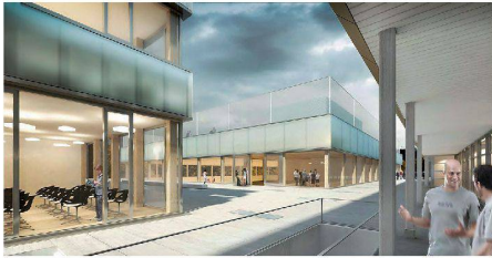
01 Zur Weiterbearbeitung: «connected»