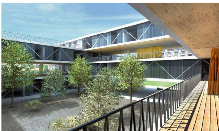
01 Zur Weiterbearbeitung: «à discrétion» (Visualisierung: Nord Architekten)

Nord Architekten aus Basel gewinnen mit dem expressiven Wohnbauprojekt «à discrétion» den Wettbewerb auf dem Baufeld 2 im Norden der Berner Stadterweiterung Brünnen.