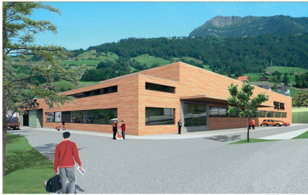
01 Siegerprojekt «Materia»: kompakt und pragmatisch organisiert

Das Team aus Suter Architekten, Pirmin Jung und Geozug gewinnt den Wettbewerb für den Werkhofneubau in Küssnacht am Rigi.