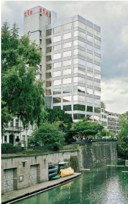
01 SIA-Hochhaus

(pd/sl) Zum 16. Mal hat die Stadt Zürich am 29. September 2011 ihre Auszeichnung für gute Bauten verliehen. Unter den 100 eingereichten Projekten mit Baujahr 2006 bis 2010 wurden schliesslich elf ausgezeichnet, darunter auch das 2007 erneuerte «SIA-Haus» (vgl. TEC21-Dossier vom August 2008). Die notwendige Sanierung des Baus aus dem Jahr 1970 hat ein Team um Romero & Schaeffle Architekten genutzt, um dem 70 Meter hohen Gebäude ein neues Gesicht zu verleihen. Mit seiner zugleich markanten und verspielten Fassade reicht die Ausstrahlung des Hochhauses weit ins städtische Gefüge hinaus. Laut Auffassung der Jury setzt die Erneuerung ein Zeichen dafür, dass sich städtebauliche, inhaltliche und energetische Aspekte form-schön miteinander verbinden lassen.