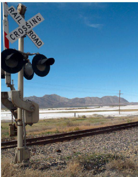
01 Black Rock Desert

(a&k) «Nevada is beautiful in her wilderness», stellte der Wissenschaftler John Muir 1878 fest. Die Faszination des 36. Bundesstaates im Westen der USA liegt in der Wüste. Auf einer Fläche von sieben Mal der Grös-