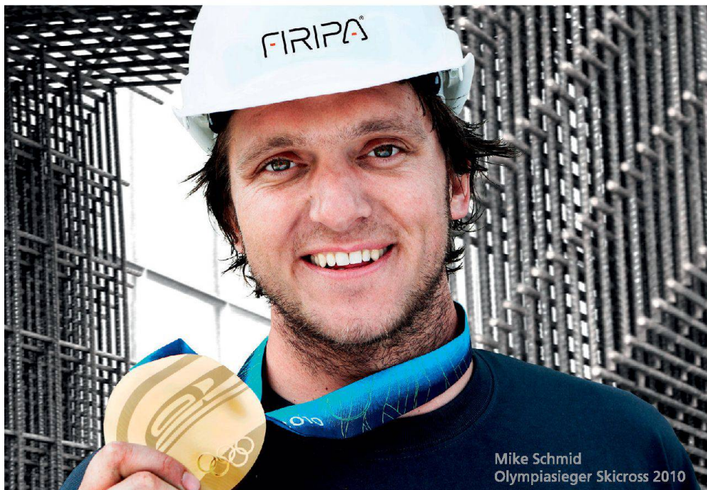
Mike Schmid Olympiasieger Skicross 2010