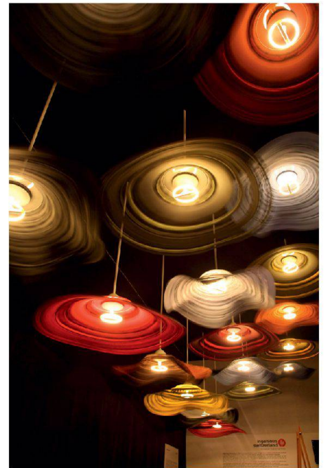
01 «Les danseuses» am Salone Internazionale del Mobile in Milano

– Matching: Das Zusammenführen von Anbietern und Nachfragern erfordert ein vertrauenswürdiges Umfeld und entsprechende Ausdauer. Erste Matchingmöglichkeiten für seine Mitglieder baut «ingenious switzerland» mit seinem Format «ingenious-intimate» auf. Im Zielland unterstützt der Verein seine Mitglieder bei der Teilnahme an ausgewählten Anlässen. Andererseits lädt «ingenious switzerland» potenzielle Auftraggeber aus den Zielländern samt Pressebegleitung in die Schweiz ein, damit diese sich anhand von Referenzprojekten vom Schweizer Know-how überzeugen können. Gleichzeitig werden die Vereinsmitglieder aus erster Hand