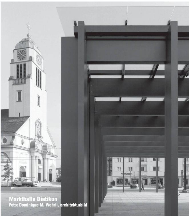
Markthalle Dietikon

Partner für anspruchsvolle Projekte in Stahl und Glas