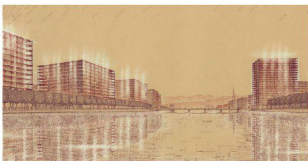
01 Vorschlag von Karl Moser für eine Neubebauung des Niederdorfs von 1933

Wie wenig die meisten Planungsvorhaben mit dem Ort und seiner Geschichte zu tun haben! Das ist eine der interessanten Beobachtungen der sehenswerten Ausstellung «verwegen – verworfen – verpasst. Ideen und Projekte zu Zürichs Stadtentwicklung 1850–2009» im Zürcher Stadthaus.