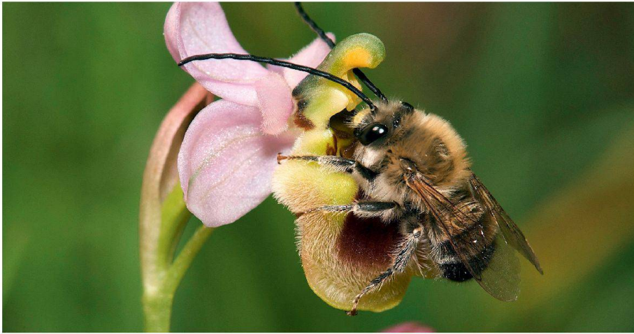
01 Die Langhornbiene ist das Tier des Jahres 2010. Sie zählt zu den rund 580 Wildbienenarten der Schweiz, von denen 45% auf der Roten Liste der gefährdeten und bedrohten Arten stehen

Im Jahr 2002 beschlossen die 193 Mitgliedsstaaten der Konvention über die biologische Vielfalt (CBD), den Verlust der Biodiversität bis 2010 signifikant zu reduzieren. Die Uno rief daher das Jahr 2010 zum Internationalen Jahr der Biodiversität aus. Im Oktober wurde nun im japanischen Nagoya an der Vertragsstaatenkonferenz über die biologische Vielfalt Bilanz gezogen.