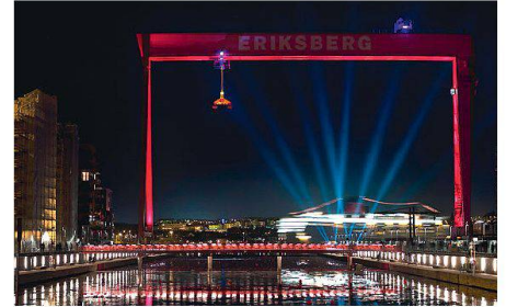
03 Göteborgs Stadterweiterung Västra Eriksberg

borg (S). In ihrer Begründung lobte die Jury Luzerns ausgeklügelte Anwendung von Beleuchtung zur Verwandlung von urbanem Erleben. Sie würdigte die gelungene Hervorhebung des Charakters der Stadt, während gleichzeitig Streulicht minimiert wird. Das südwestfranzösische Pau erhielt den zweiten Preis für die Ausleuchtung des historischen Schlosses, das heute als Museum genutzt wird. Der Ersatz für eine dreissig Jahre alte Beleuchtungsinstallation bringt laut Jury «überliefertes Erbe und Nachhaltigkeit in ein optimales Gleichgewicht». Die Göteborger Planenden zielten mit ihrem Projekt hingegen