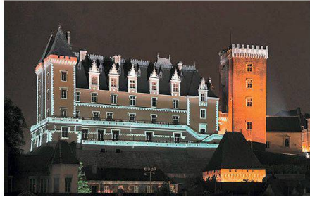
02 Château de Pau (F) aus dem 14. Jahrhundert

(af) Nach Genf, St. Gallen und Lachen erhält dieses Jahr Luzern den internationalen «city.people.light» Award. Der jährliche Wettbewerb wurde zum achten Mal in Folge von Philips und der Lighting Urban Community International Association (LUCI) organisiert. Aus 27 Eingaben von Stadtverwaltungen aus der ganzen Welt wählte die sechsköpfige Jury neben Luzern Ville-de-Pau (F) und Göte-