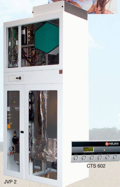
VP 18 Compact