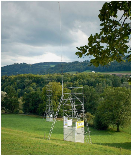
01 Die maximale Höhe der Baugespanne beträgt am tiefsten Punkt des Terrains 40 m. Die «Gestaltung» wurde der Gerüstbaufirma überlassen

Im Rahmen der Ausstellung «Kunst am Wasser» hat der Berner Architekt und Künstler Ronny Hardliz mit den Medien des Baubewilligungsverfahrens in der Berner Elfenau einen Ort realisiert, der provoziert und Raum für Interpretationen lässt.