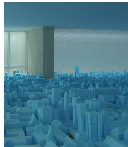
03 «Vacant NL, where architecture meets» im niederländischen Pavillon

Die 12. Architekturbiennale Venedig, kuratiert von der diesjährigen Pritzkerpreisträgerin Kazuyo Sejima, steht unter dem Titel «People meet in Architecture». Sowohl in der Hauptausstellung als auch in den Länderpavillons fällt die hohe Anzahl Beiträge auf, die das Thema auf einer künstlerischen Ebene zu behandeln – oder zu umgehen – versuchen. Im Gegensatz dazu brilliert Rem Koolhaas mit präziser Kritik. Ein Besuch lohnt sich.