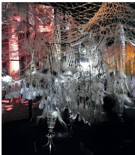
02 «Hylozonic Ground» von Philip Beesley Architect Inc. im kanadischen Pavillon