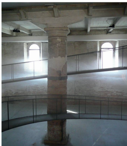
01 Installation von Transsolar + Tetsuo Kondo, Hauptausstellung im Arsenale