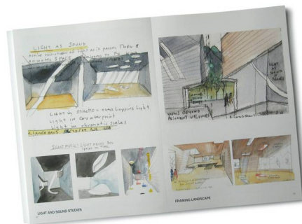
05 Steven Holl entwickelt seinen unterirdischen Entwurf aus Stockhausens «Stimmung»