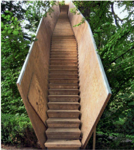
01 Treppenaufgang

Vor 150 Jahren erhielt der 1789 gegründete und immer wieder verlegte Botanische Garten Bern (BOGA) seinen endgültigen Platz am nordöstlichen Aareufer. Zum Jubiläum gab es eine begehbare Baumtreppe von Studierenden der Berner Fachhochschule Architektur, Holz und Bau.