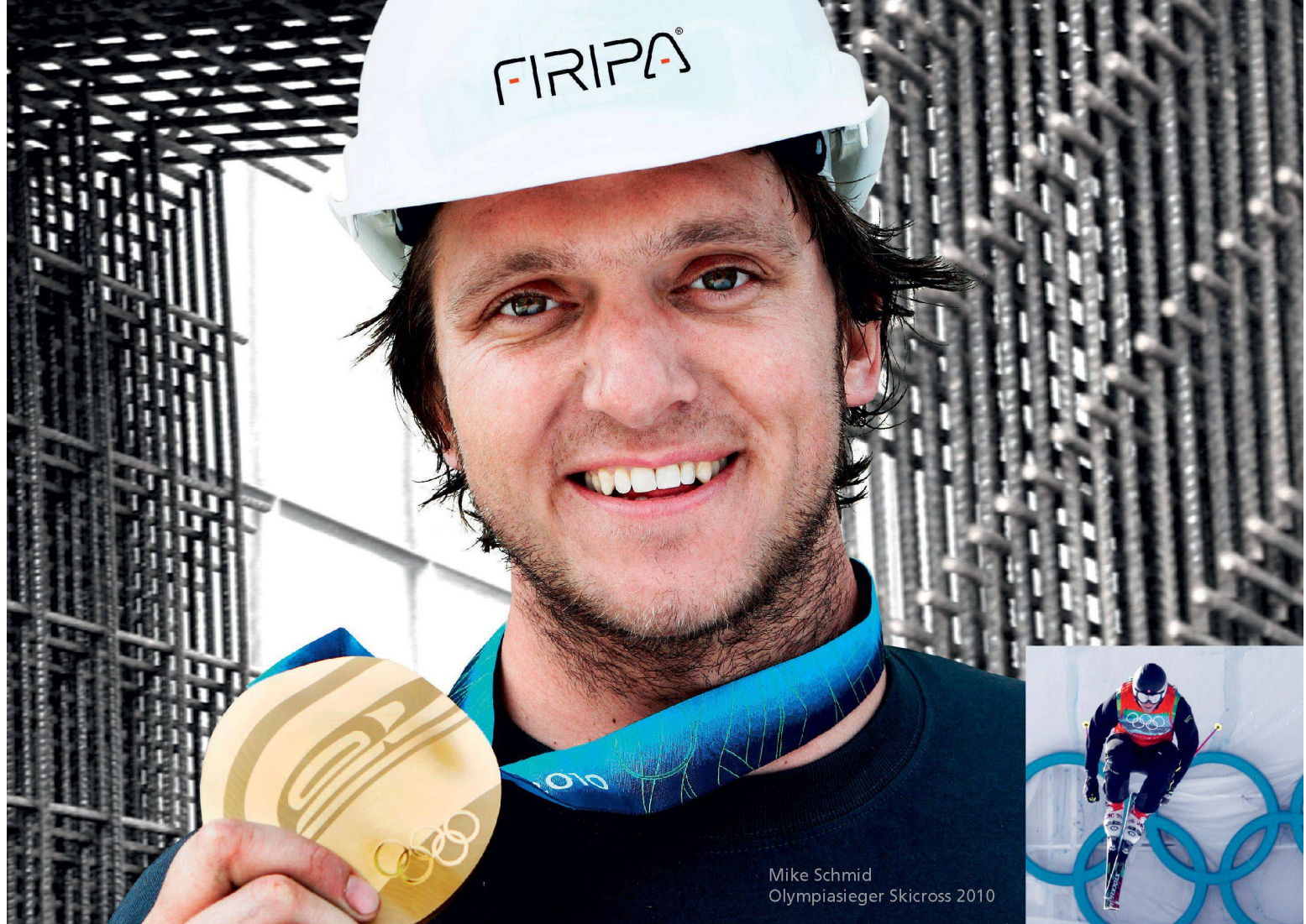
Mike Schmid Olympiasieger Skicross 2010