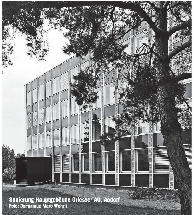
Sanierung Hauptgebäude Griesser AG, Aadorf

Preis und Leistung stehen bei uns täglich im Mittelpunkt. Geringere Kosten bedeuten nicht automatisch weniger Qualität oder mangelnde Flexibilität. Fragen Sie uns an.