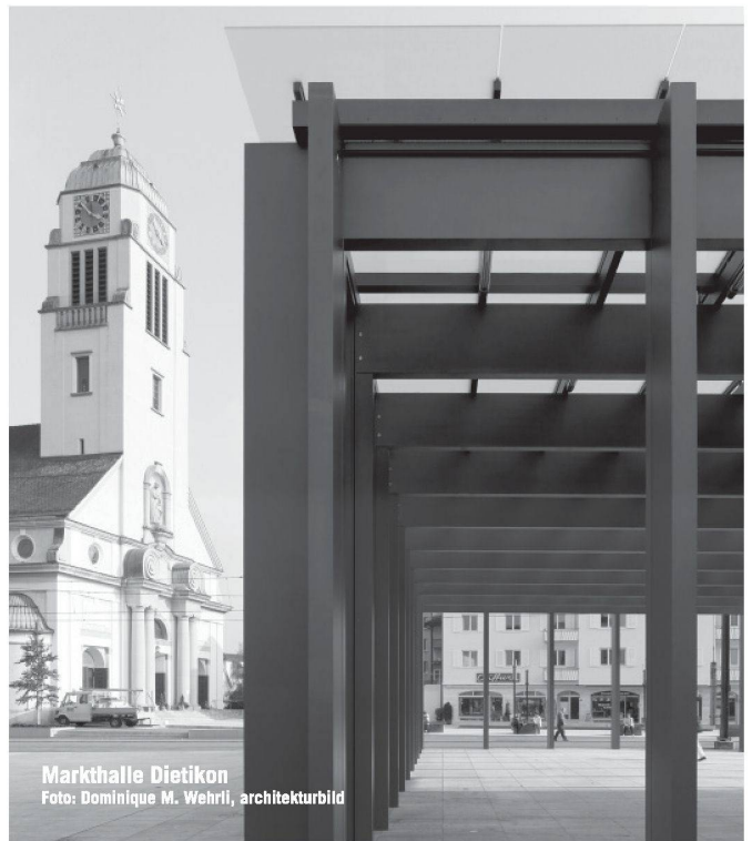
Markthalle Dietikon

Preis und Leistung stehen bei uns täglich im Mittelpunkt. Geringere Kosten bedeuten nicht automatisch weniger Qualität oder mangelnde Flexibilität. Fragen Sie uns an.