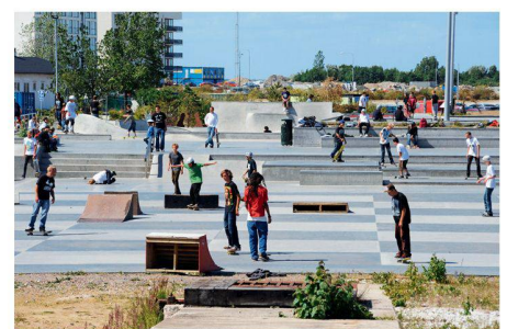
08 Alt und Jung, Anfänger und Profis treffen sich im Stapelbäddsparken