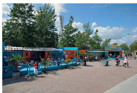
07 Café, Bibliothek und Klettertürme ergänzen die Skaterpools