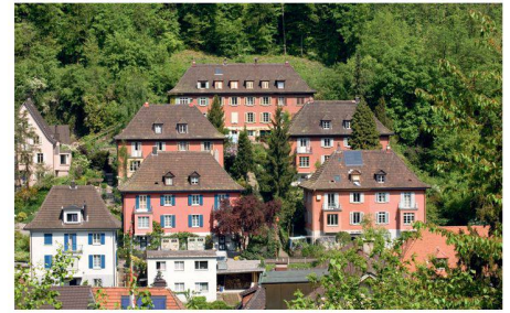
01–03 «Lokalmatador» Hans Loeffle: drei Einfamilienhäuser am St. Annaweg, sein eigenes Haus im Stil des Neuen Bauens am Mühlbergweg 27 (1934/35) und die Siedlung an der Sonnmattstrasse 16 bis 38 (1925–1928)

Baden hat ein vielfältiges bauliches Erbe von hoher Qualität. Mit der Überarbeitung des Inventars schützens- und erhaltenswerter Bauten wird der Leitfaden zum Umgang mit diesen Zeugen aktualisiert.