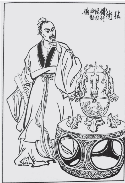
01 Der chinesische Universalgelehrte Zhang Heng (78–139) beobachtet das von ihm im Jahr 132 entwickelte Seismoskop

Bereits die «Söhne des Himmels», die als Kaiser über das alte China herrschten, erkannten Erdbeben, Seebeben und dadurch ausgelöste Flutwellen als potenziell grösste und unberechenbarste Naturgefahr in ihrem Reich. Sie förderten die Erforschung und mögliche Prävention dieser Erscheinungen mit den damals bekannten wissenschaftlichen und spirituellen Mitteln.