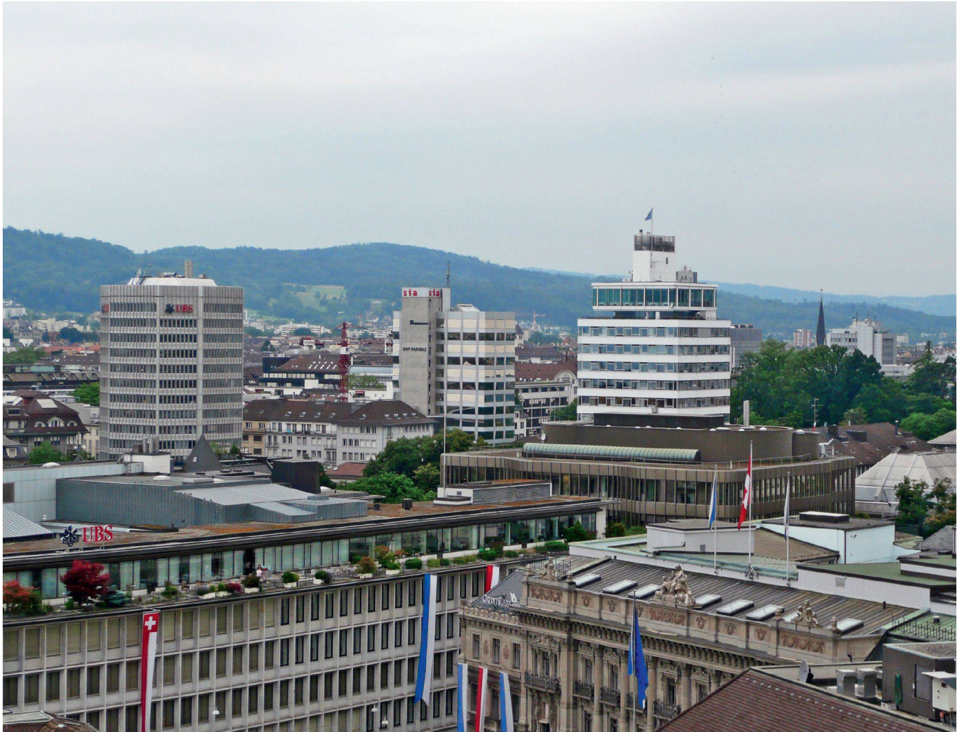
01 SIA-Haus in der Zürcher Skyline – im Vordergrund der Paradeplatz