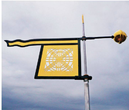
01 Von Anna-Maria Bauer entworfene Wetterfahne auf dem Stadthausurm Zürich im Sommer 2008