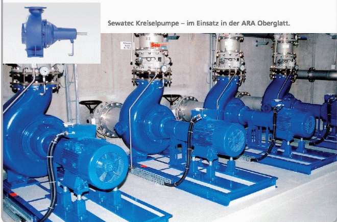
Sewatec Kreiselpumpe – im Einsatz in der ARA Oberglatt.

Hochbauamt Lämmlibrunnenstrasse 54, 9001 St.Gallen Telefon 071 229 30 17, Fax 071 229 39 94