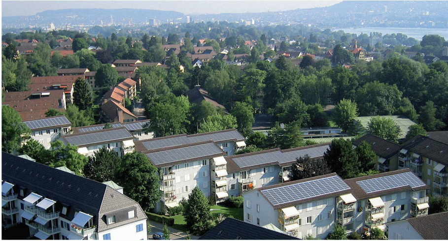
01 Strom von den Dächern einer Zürcher Baugenossenschaft

Sonnenkollektoren und Fotovoltaik-Module können teilweise auch in engen städtischen Verhältnissen platziert werden. Eine dreidimensionale Simulation erlaubt, die jeweiligen Möglichkeiten abzuschätzen.