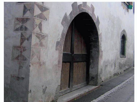
Atheco AG | Halle 2, Stand B 13 www.atheco.ch

Form von Gift- und Konservierungsstoffen zu verzichten. Der Micro-Pore-Entfeuchtungsputz ist hoch wasserdampfdurchlässig und sorgt für eine dauerhafte Abtrocknung von feuchten Mauern. Durch die spezielle Mikroporen- und Kapillarenstruktur verdunstet das im Mauerwerk befindliche Wasser sehr schnell, und gleichzeitig wird der Weitertransport von Wasser in flüssiger Form verhindert. Die Salze gelangen somit nicht an die Oberfläche. Problemwände sowohl im Innen- wie im Aussenbereich können mit diesem Produkt nachhaltig und kostengünstig saniert werden.