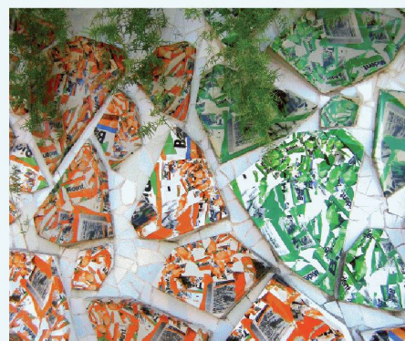
03 Moderne Mosaik à la Gaudí mit Zeitungstext verziern die schwebenden Blumentöpfe

„ Wir sind in Nürnberg dabei, weil wir auf der Chillventa mit unserer MSR-Technik eine wichtige Rolle spielen. “