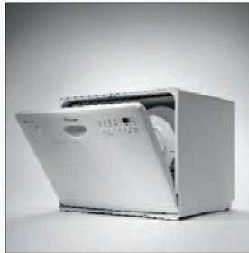
Die kompakte Lösung.