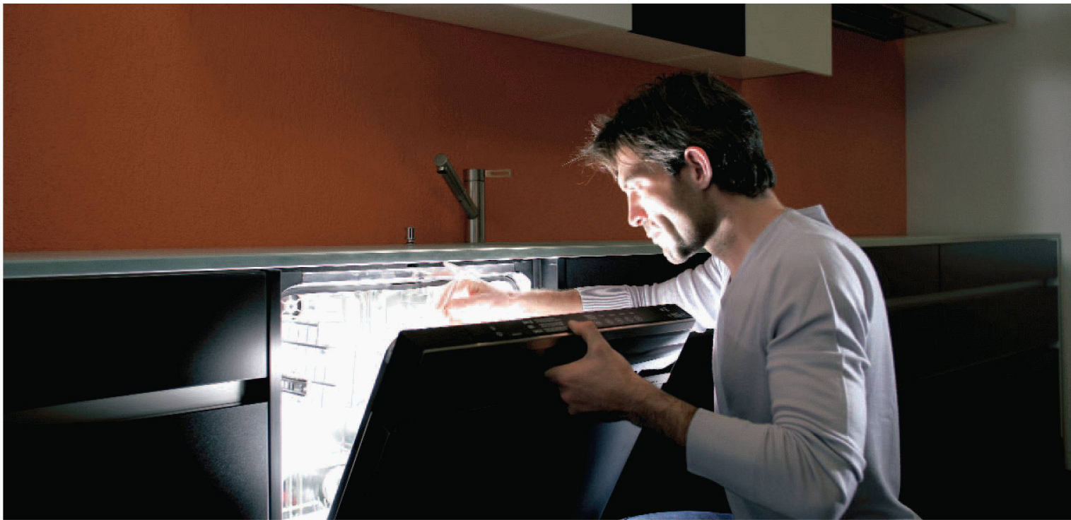
Einfach schön, wenn Teller und Gläser im richtigen Licht erscheinen: Die komfortablen Electrolux-Geschirrspüler machen es möglich.