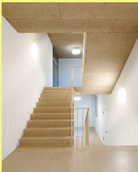
04 Der Neubau ist, um ein halbes Geschoss nach unten versetzt, im Treppenhaus mit dem Altbau verbunden