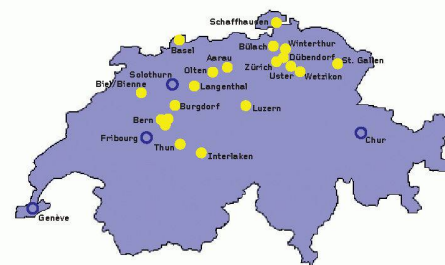
Velostationen in Betrieb (gelb) und in Bau/Planung

sprünglich bis Ende 2006 einbauen. Die Verzögerung erklärt das Baudepartement mit der Tatsache, dass der Auftrag für die neuen Veloständer öffentlich ausgeschrieben werden musste. Im vergangenen Jahr sei das Tiefbauamt vermutlich davon ausgegangen, dass dies nicht notwendig sei. Die Ausschreibung ist inzwischen abgeschlossen, und der Ausbau wird nach Auskunft des Tiefbauamtes in den nächsten Wochen beginnen. Ob die neuen Abstellplätze ausreichen, um den Kapazitätsengpass zu beseitigen, bleibt abzuwarten.