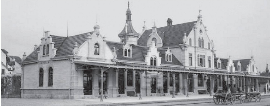
Der Bahnhof Rapperswil um 1905

(sda/rw) Das 1895 von Architekt Karl August Hiller gebaute Bahnhofgebäude in Rapperswil wird umgebaut. Bis Mitte 2008 wird das 1956 angebaute Buffet abgebrochen, sodass die originale historistische Architektur des Bahnhofs wieder sichtbar wird. Im Innern werden Zwischendecken entfernt, die Räume erhalten wieder ihre ursprüngliche Höhe. Die rekonstruierte Haupthalle wird künftig das SBB-Bahnreisezentrum, ein Restaurant und ein Café aufnehmen. Das Perrondach wird erneuert und neu gestaltet. Ursprünglich war ein Abbruch geplant; der Heimatschutz wehrte sich dagegen.