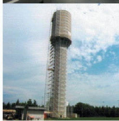
Behälter- und Bäderbau