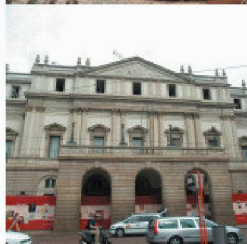
Neubauten in und an bestehenden Bauten

Durch die über 40-jährige Erfahrung und Spezialisierung auf vorbeugende und sanierende Abdichtung gegen drückendes Wasser, sowie ständige Weiterentwicklung der Produkte und Lösungen, können Sie mit RASCOR nur gewinnen.