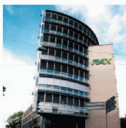
Gewerbe- und Wohnbau