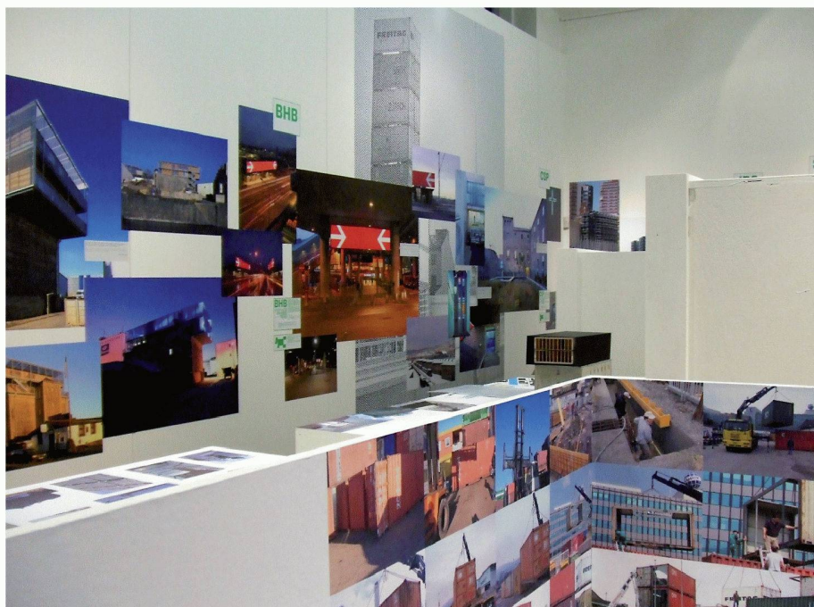
Installationsansicht des Hauptraumes im Schweizerischen Architekturmuseum Basel

Während Isa Stürm und Urs Wolf ein Modell der Lockremise an die Wand hängen und differenziert ihr Vorgehen, die Lesung des Altbaus und Methoden der Re-Animation beschreiben, erläutern EM2N ihre Aufwertungsstrategien für die Hardbrücke und die Zerschneidung des SBB-Logos in zwei weisse Pfeile in rotem Signet. Ganz anderer Art ist die fast schon künstlerische Arbeit im Münchner Kunstverein von ifau und Jesko Fetzer, die, um den Eingangsbereich aufzuwerten, einen riesigen Tisch installierten, der durch seine Ausmasse den Besucher zwingt, sich zu ihm zu verhalten. Er wurde je nachdem vom Laufsteg bis zum Besprechungstisch unterschiedlich eingesetzt. Auch die Temporären Gärten von Atelier Le Balto in Berlin stellen geringfügige Eingriffe in die Resträume oder Randbereiche der Stadt dar, in denen das Unkraut mit in die Planung integriert wurde. Ihre Platzierungen erhalten durch den sachlichen Blick der Architekturfotografen Hiepler und Brunier eine romantische Note, die der harten Realität der Umbauten mit minimalen Mitteln eine neue Dimension verleiht.