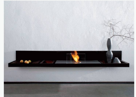
Conmoto | D-33442 Herzebrock-Clarholz www.conmoto.com

den «Balance nature» aufgenommen. Die aus amerikanischem Nussbaum oder Eichenholz handwerklich gefertigten Kommoden, Regale, Kaminholz-Behälter, Bänke und Hifi/TV-Module fügen sich harmonisch in die horizontale Linienführung ein. Das Holz ist mit geölten, natürlichen Oberflächen versehen, die Seitenwangen sind aus gebürstetem Edelstahl oder schwarz pulverbeschichtet. Holzmöbel und Kaminofen können dank den dazwischen eingebauten Luftkammern direkt nebeneinander stehen. Die Wärme des Ofens wird durch sie nach oben abgeleitet.