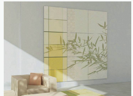
Anathome AG | 8320 Fehraltorf www.anathome.com

Die sichtbare Oberfläche, das Paneel, wird auf die mit Magneten bestückte Aluminiumstruktur geklickt. Die Aluminiumstruktur wird mittels justierbaren Aufhängemodulen fest mit der Wand verbunden. Bei dieser neuen Art von Wechselrahmen sitzt der Inhalt also nicht im Rahmen, sondern auf dem Rahmen. Dank der benutzerfreundlichen Magnetverbindung kann die Oberfläche schnell und ohne Werkzeuge montiert, ausgewechselt oder neu gruppiert werden. Die Paneele können einzeln, in einer Gruppe oder wandfüllend eingesetzt werden.