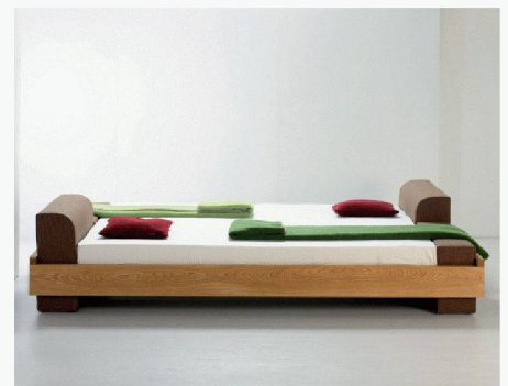
lucas bett & raum | A-1200 Wien www.lucas-bett.at

in den internationalen Handel. Bei «lubelilo» verbindet eine raffinierte Holzsteckverbindung vier gerade, ineinander gesteckte Bretter ohne Metallteile und überstehende Kanten. Das Bett ruht scheinbar auf «durchgesteckten» Polsterelementen. Zum Bett «lubelila» gibt es austauschbare Polsterelemente, die als Lehne, Kopfstütze, Stauraum und praktische Verlängerung der Matratze dienen können. Als Zubehör gibt es den Beistelltisch «lutilo» und die Bettbank «lubalu». Der Beistelltisch hat zwei schwebende Abstellflächen und verwandelt sich per Dreh in einen praktischen Hocker.